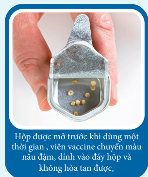
Hộp được mở trước khi dùng một thời gian, viên vaccine chuyển màu nâu đậm, dính vào đáy hộp và không hòa tan được.