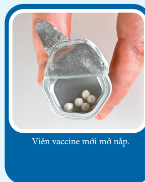
Viên vaccine mới mở nắp.

Viên vaccine sẽ hút ẩm từ môi trường, chuyển thành màu nâu đậm, dính vào đáy hộp và không hòa tan được. Nếu hộp vaccine mở lâu, có thể viên vaccine sẽ teo lại.